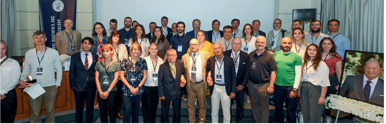
Sempozyuma katılan arařtırmacılarla çekilen hatıra fotoğrafi.